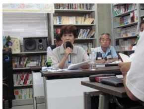
第42回総会主催者挨拶

会館4階ホールで家族クラブあさがお第42回定期総会を開催しました。総会には、各支部から役員と組合員皆さんの50名以上が参加しました。